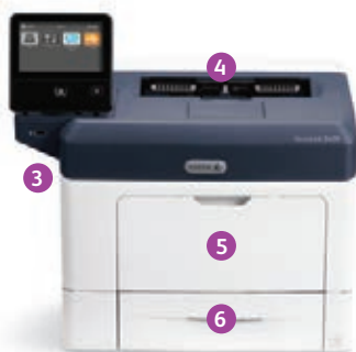
Xerox® VersaLink® B400 printer Print.

2 USB-poorten kunnen worden uitgeschakeld; 3 alleen voor VersaLink B405.